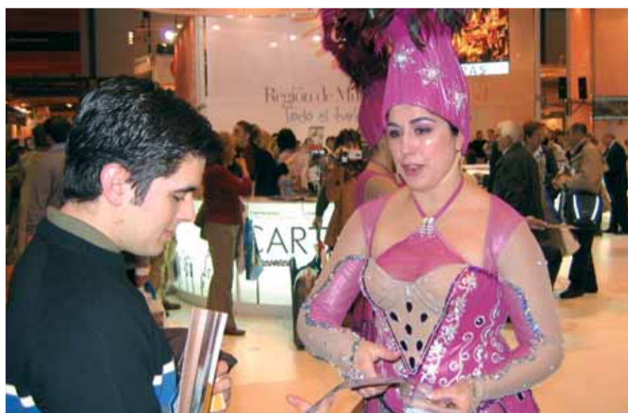
Chicas de Ipanema: El mostrador de Águilas contó con el refuerzo de dos azafatas "carnavaleras"