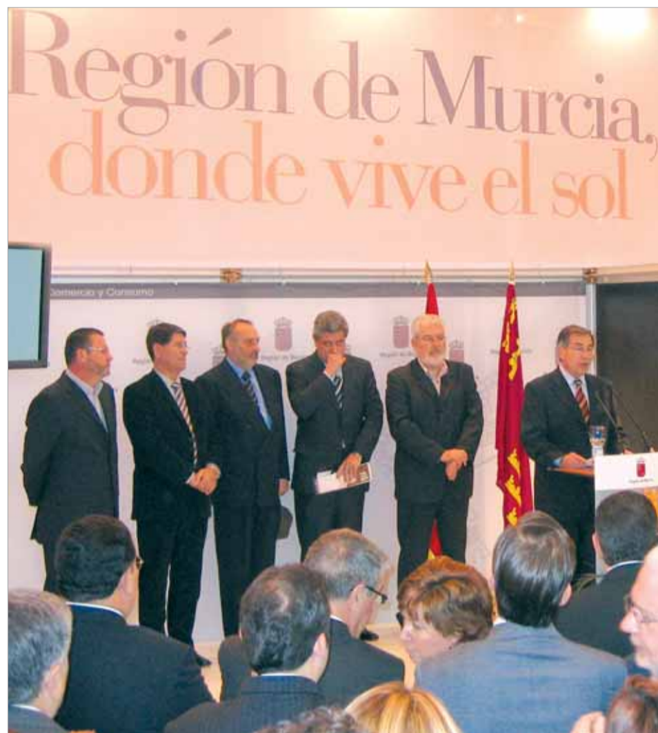
En la imagen, momentos de la presentación del Plan Director de Turismo

del patrimonio cultural, natural e histórico. Además, el Plan Director de Turismo de la Región de Murcia identifica los productos turísticos prioritarios y establece nueve líneas estratégicas de actuación, que se desarrollan en 22 planes o programas y que contienen, a su vez, medidas y acciones. Entre las citadas líneas estratégicas destacan el impulso y consolidación de destinos turísticos, el desarrollo y la creación de grandes productos turísticos, la actuación de interés regional "Marina de Cope, el desarrollo de complejos turísticos, la calidad de los destinos y el impulso a la promoción y comercialización, entre