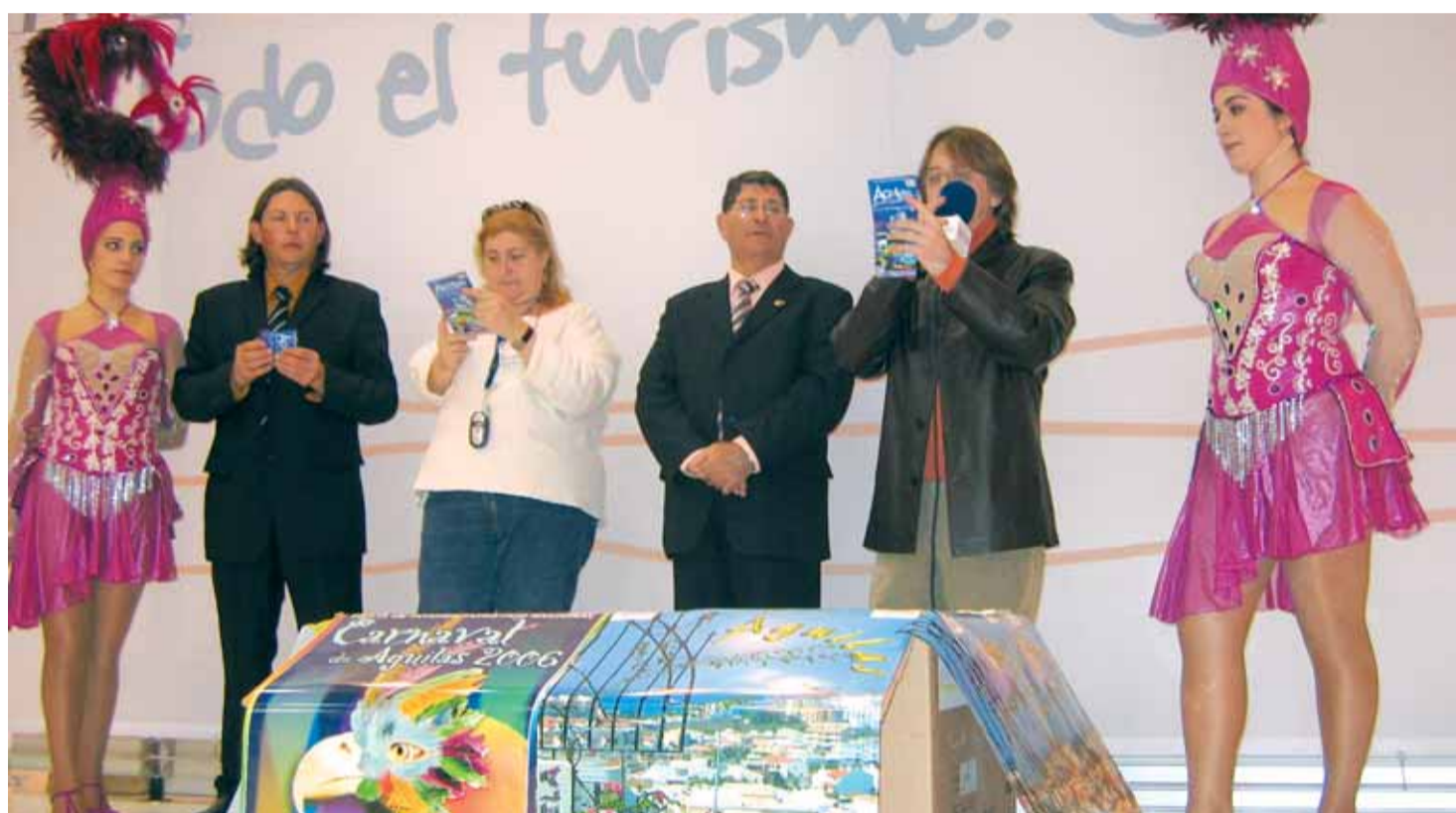
En la imagen, momentos del sorteo de fines de semana gratuitos en hoteles aguileños

Distribución gratuita y conjunta con La Actualidad de Murcia