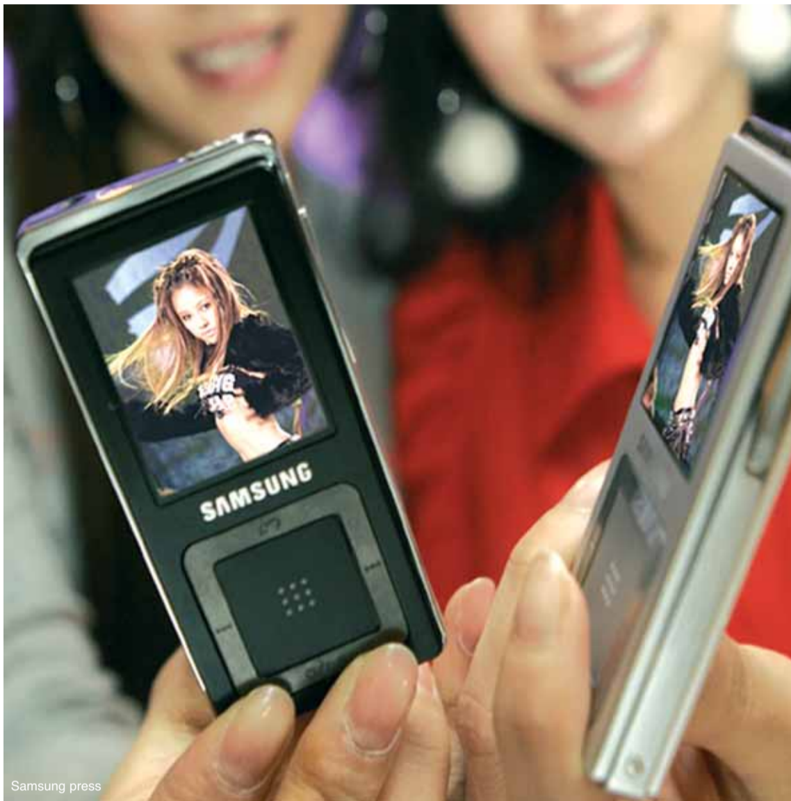
Los nuevos modelos de Samsung están entrando fuerte en este competido mercado

ESTOS REPRODUCTORES SE HAN CONVERTIDO EN UNA MODA DE LA QUE POCOS TRATAN DE ESCAPAR